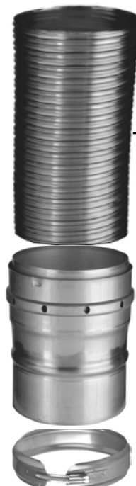
FU45 Хомут обжимной