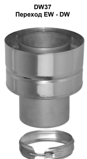
DW37 Переход EW - DW