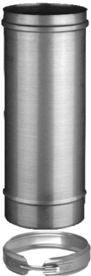
FU45 Хомут обжимной